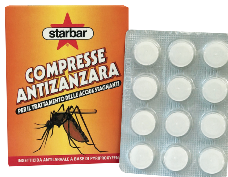
cod. E64 25 - 12 compresse

DISPONIBILI IN OFFERTA SPECIALE DAL 1 SETTEMBRE 2018