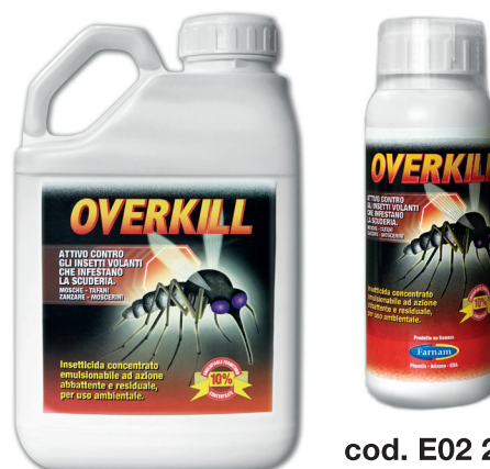
cod. E05 25 - 5 lt